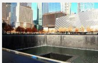
911 遗址 (归零地)