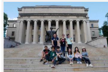
哥伦比亚大学参访