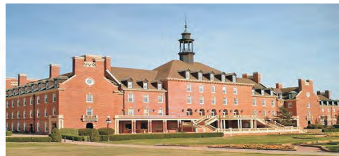
美国俄克拉荷马州立大学