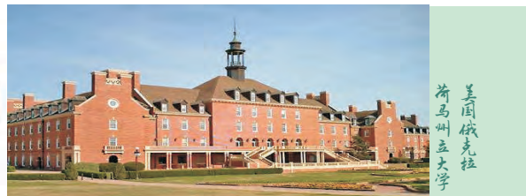
美国俄克拉荷马州立大学