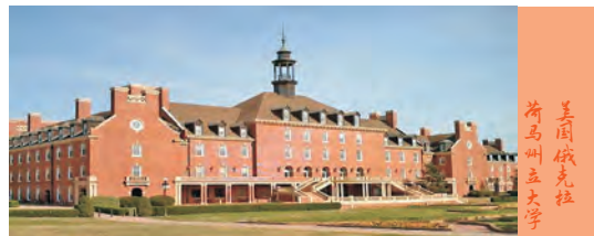
美国俄克拉荷马州立大学