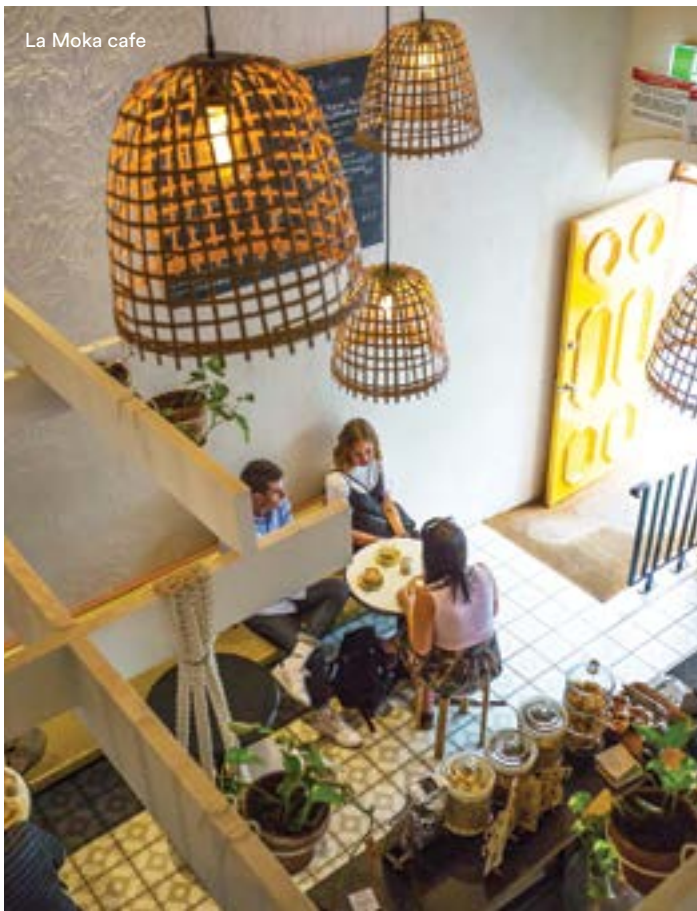
La Moka cafe