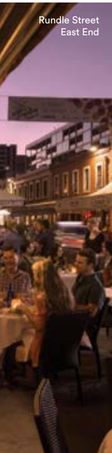
Rundle Street East End