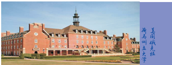
美国俄克拉 荷马州立大学