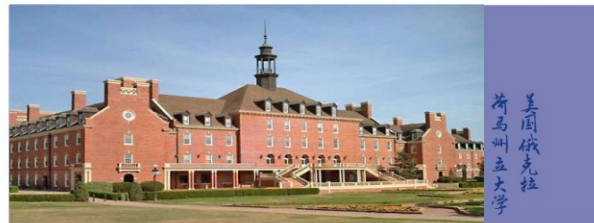
美国俄克拉荷马州立大学