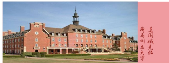
美国俄克拉荷马州立大学