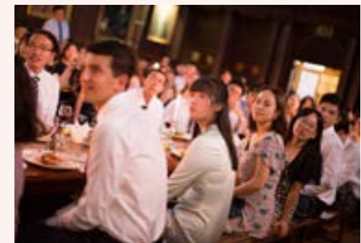
OPP Photo Wall