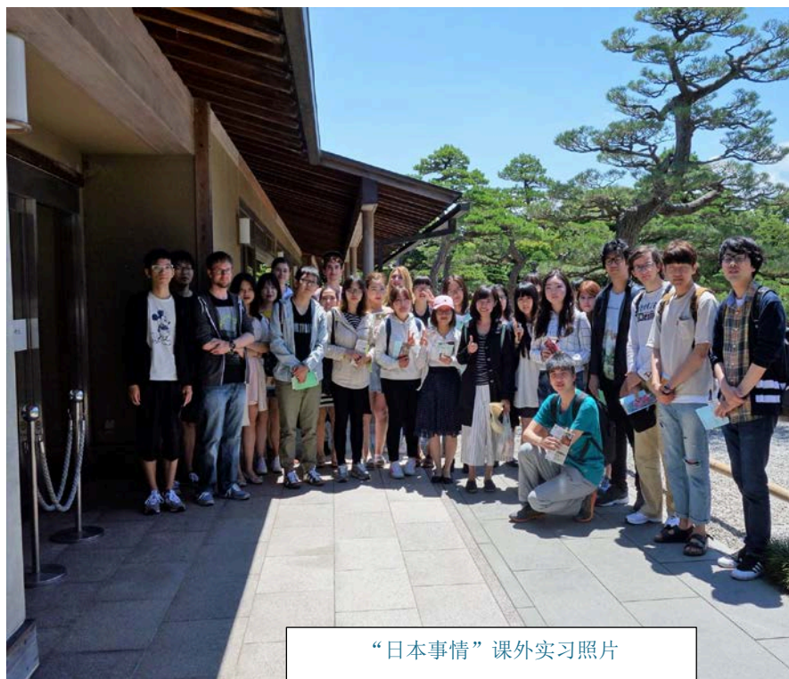
“日本事情”课外实习照片