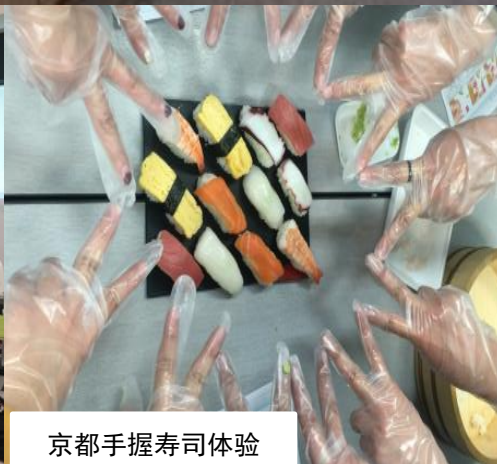
京都手握寿司体验