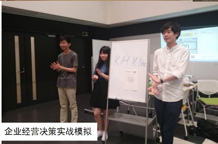
企业经营决策实战模拟